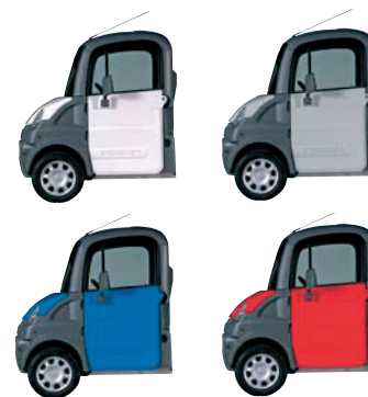
Keuze uit 4 kleuren